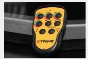
Дистанционное управление дальностью 50 м