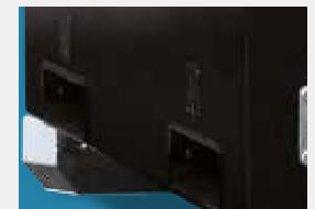
Карманы для погрузчика