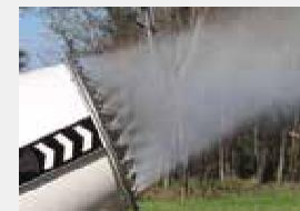
Коронка из нержавеющей стали с 36 соплами