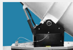
Электрическая система наклона и поворота на 340 °