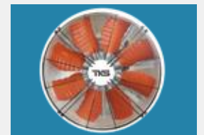
Нагнетатель диаметром 900мм