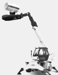
TKS-40 hydraulic driven