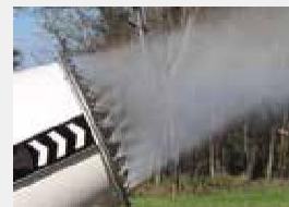
Коронка из нержавеющей стали с 24 соплами