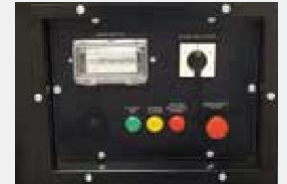
Интегрированная панель управления