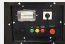
Интегрированная панель управления