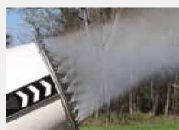
Распылитель из нержавеющей стали на 24 сопла