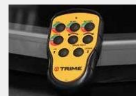
Дистанционное управление дальностью 50 м